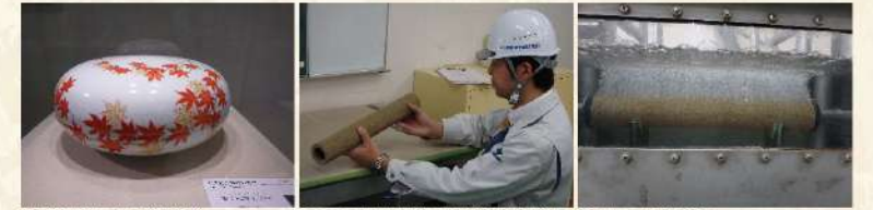
15代 酒井柿右衛門 作 ①有田 岩尾磁器工業(株)材料検査 ②有田 材料検査

山形市浄化センターの工程で言うところの、曝気槽(エアレーションタンク)で使用されている、散気装置(多孔質セラミックス製散気材)写真①②。厳密な粒土管理のもとに作られたセラミック製粒子を無機質バインダーを用いて高温燃焼したもので、均一な気孔より発生する微細気泡は均一発泡性の高い酸素移動効率を有します。また強度・耐熱性にも優れ長時間安定した散気性を維持します。今回この散気装置(有田生産)の交換工事を行っています。③既設配管・散気装置撤去後、新設配管・散気装置設置完了。この技術は、日本白磁発祥の地「有田」有田焼三百八十年の伝統の技術が生きています。