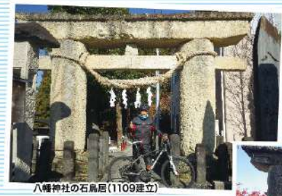
八幡神社の石鳥居(1109年建立)

みなさんご存知ですか? 山形は、石鳥居の宝庫です。 (地震や災害が少ないため。) 山形市内には、「元木の石鳥居」・ "八幡神社の石鳥居"有名ですよ! (国指定重要文化財)