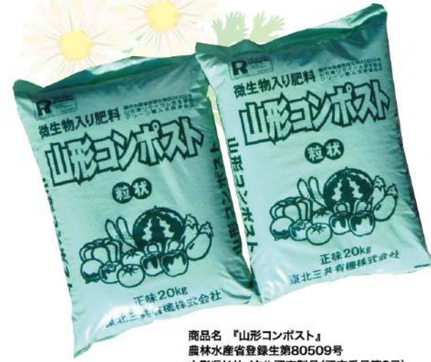
商品名「山形コンポスト」 農林水産省登録第80509号 山形県リサイクル認定製品(認定番号第8号)

「山形コンポスト」は、山形市浄化センターで発生した下水汚泥を発酵処理した有機肥料です。有効微生物などの有機物質を豊富に含んでいますので、土壌を元気にして、健康な作物づくりができ、綺麗な花を、より綺麗に。美味しい野菜を、より美味しく。花・野菜・芝などに効果的です。また、山形県リサイクル認定製品の、環境にやさしいリサイクル製品です。ぜひご利用ください。