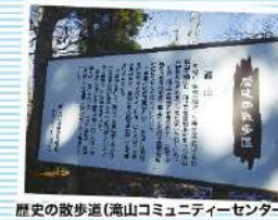
歴史の散歩道(湯山コミュニティセンター)