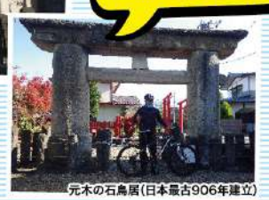
元木の石鳥居(日本最古906年建立)

みなさんご存知ですか? 山形は、石鳥居の宝庫です。 (地震や災害が少ないため。) 山形市内には、「元木の石鳥居」・ "八幡神社の石鳥居"有名ですよ! (国指定重要文化財)