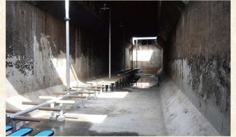
③山形市浄化センター・曝気槽内部・散気装置設置完了