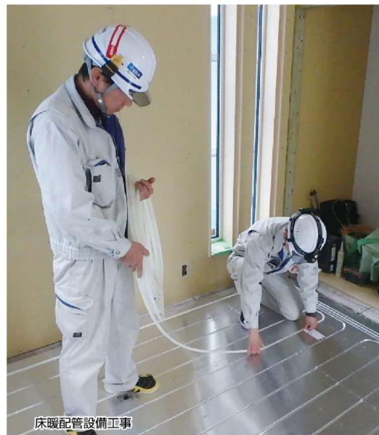
床暖配管設備工事

山住設備に入ってまだ日は浅いですが、一刻も早く仕事を覚えて、少しでも会社に貢献できるように頑張ります。