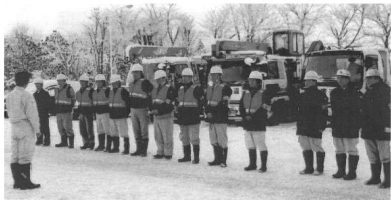
緊急支援派遣隊(山形市管工事組合)出発式