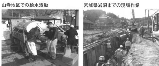
山形地区での給水活動